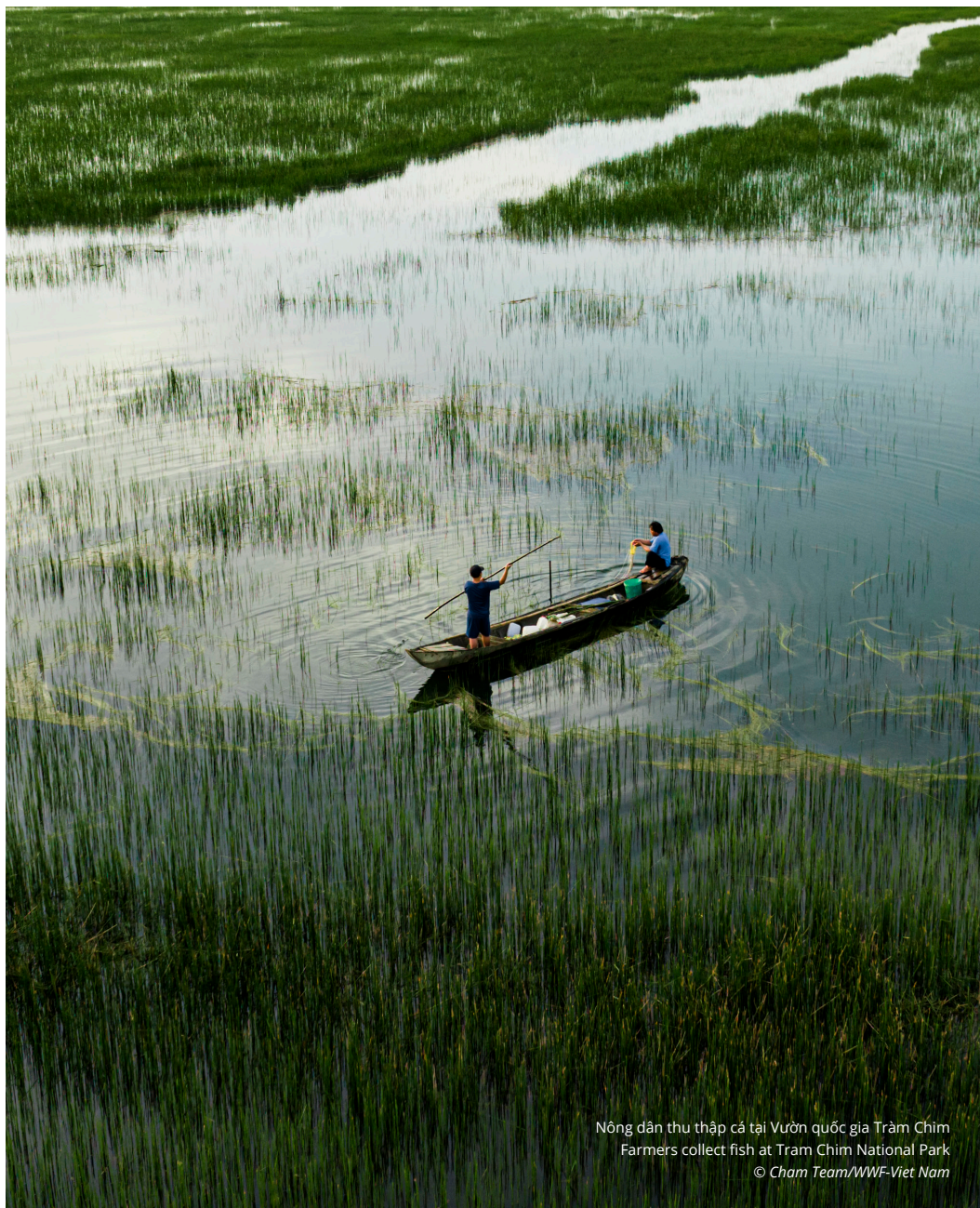
Nông dân thu thập cá tại Vườn quốc gia Tràm Chim Farmers collect fish at Tram Chim National Park